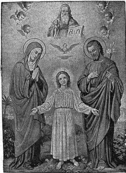
Die heilige Familie

Wir bringen folgende Formulare für den Verein der christlichen Familie in freundliche Erinnerung: