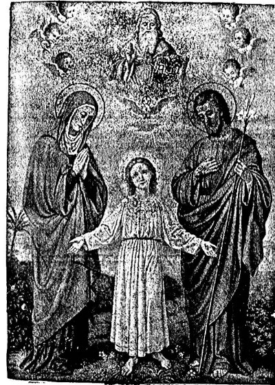
Die heilige Familie.

Wir bringen folgende Formulare für den Verein der christlichen Familie in freundliche Erinnerung: