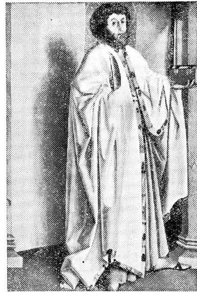
Konrad Witz: Der Apostel Bartholomäus