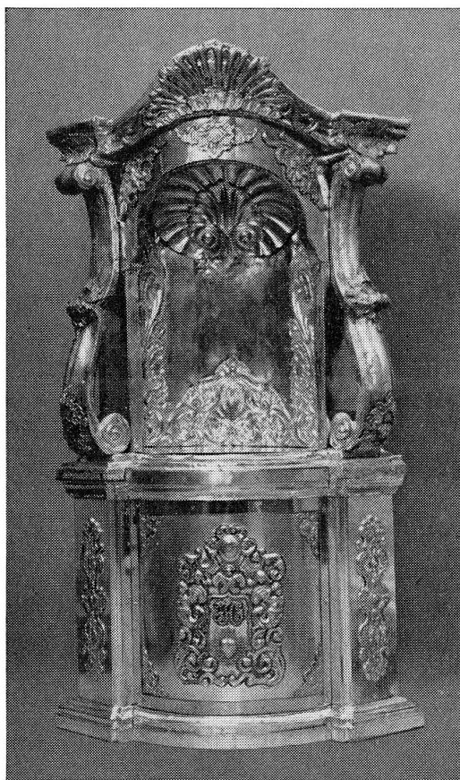
Barock-Tabernakel aus meiner Werkstatt (Auslandauftrag)

Seit 65 Jahren bei der Hofkirche und Lokalmieter des Stiftes zu St. Leodegar.