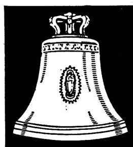
Aarauer Glocken seit 1367