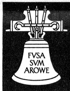
Aarauer Glocken seit 1367