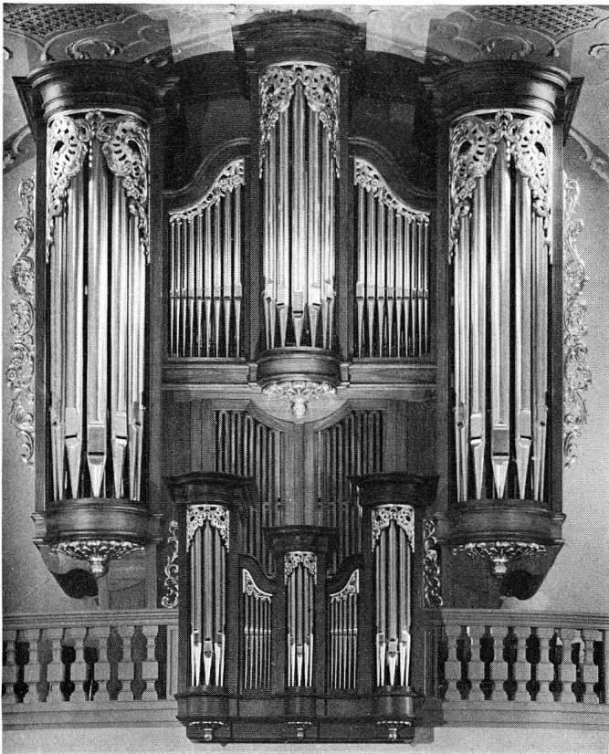
Neue Orgel Stadtkirche Sursee

W. Cadonau + W. Okle Telefon 073 - 22 37 15