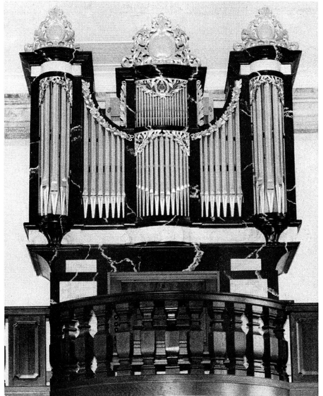
Wallfahrtskapelle Gormund/Neudorf LU

Orgelbau W. Graf 6210 Sursee, Telefon 045 - 21 18 51