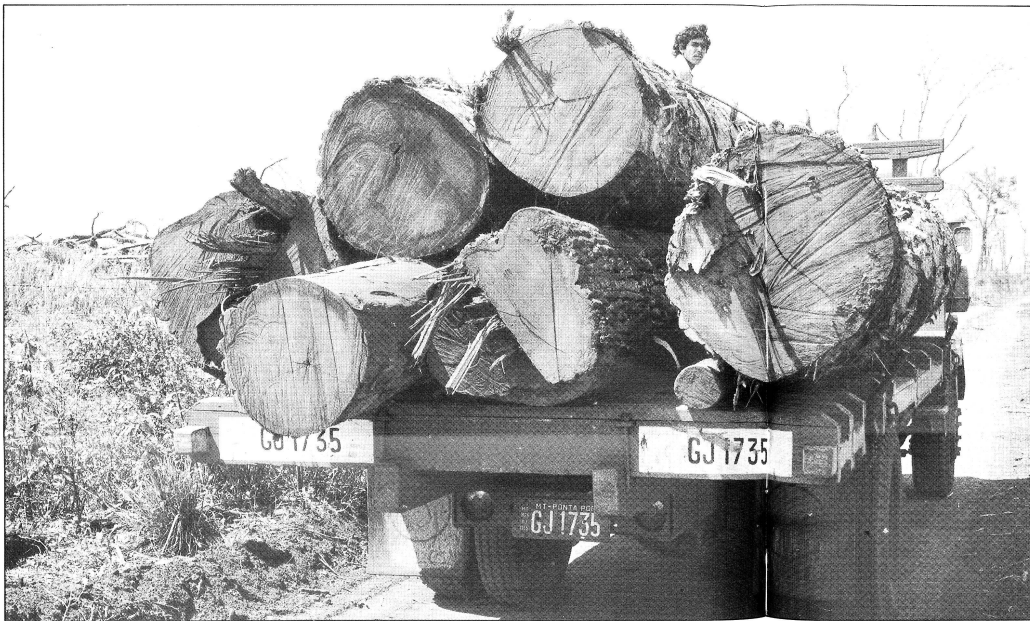
Dem Raubbau am tropischen Regenwald Einhalt gebieten will das «Klima-Bündnis» zwischen Städten Europas und indigenen Völkern. Eine Wende in der Geschichte der 500 Jahre? Foto: 1988