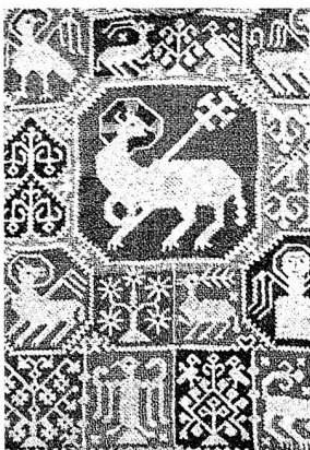
Verborgene Schätze Stickerei (14. Jahrhundert) in der Sonderausstellung von Kulturgütern aus der Benediktinerinnen-Abtei St. Andreas, Engelberg und Sarnen, mit Leihgaben aus Schweizer Museen im Museum Bruder Klaus, Sachseln, bis 15. Juli 2000 (Dienstag bis Sonntag, 9.30–12 und 14–17 Uhr)