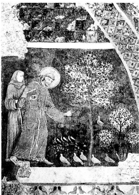
Franz von Assisi

Die Armen und Besitzlosen beschäftigen Franziskus in zunehmendem Masse, lassen ihn gewissermassen nicht mehr los. Wie er an einem Tag einen Bettler abweist, der ihn um ein Almosen bat, macht er sich danach grosse Vorwürfe und ruht nicht, bis er ihn aufgefunden und ihm eine Gabe gereicht hat. Ganz allmählich begreift er die Tragweite der verschiedentlich erhaltenen Weisungen, löst sich von seinen früheren Freunden, den prächtigen Kleidern, dem ganzen Lebensstil, in dem er aufgewachsen ist, wie auch von den üppigen Festen, die er zu feiern liebte. Franziskus wählt die radikale Armut in allen Bereichen, erlebt Verständnislosigkeit, Spott und Verhöhnung, schwört den Zorn des zutiefst enttäuschten Vaters herauf. Erste Gefähr-