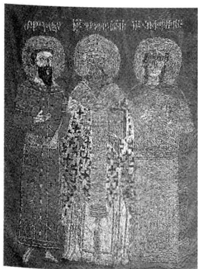
1700 Jahre Armenisch-Apostolische Kirche Ausstellung im Flur 2100 der Universität Freiburg zum 1700-jährigen Jubiläum der offiziellen Proklamation des Christentums in Armenien (bis 6. April 2001; Bild: Banner mit Grigor, dem Erleuchter).