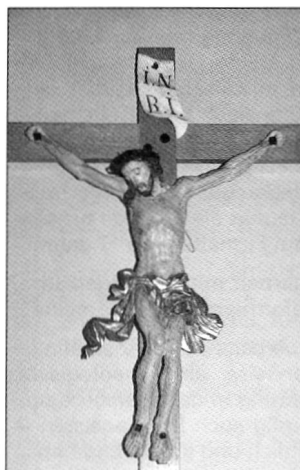
Höhe: 95 cm