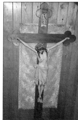
Höhe: 180 cm