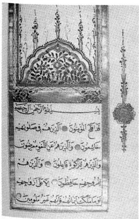
Islamischer Alltag in Zürich Ausstellung im Stadthaus bis 25. Januar 2002 (Montag–Freitag 8–18 Uhr, Samstag 8–12 Uhr); siehe dazu auch in dieser Ausgabe Seite 653f.

Das Buch der Psalmen ist nicht aus einem Guss. Verschiedene Sammler und Redaktoren haben zu seinem Wachstum und zur abschliessenden