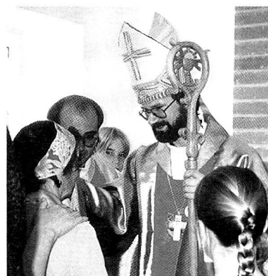
Der 40-jährige Bischof Clemens Pickel in vollem Ornat bei einem Gottesdienst in Saratov (Russland).

züglich Deutsch spricht, wird über seine riesige Diözese und ihre Probleme berichten: Fläche 1,4 Mio. Quadratkilometer, 42 Mio. Einwohner, davon 100 000 weit verstreut lebende Katholiken. Es herrscht Armut und Priestermangel in Südrussland; Drogensucht, Alkoholismus und schwere Krankheiten breiten sich aus, und das Drama der tschetschenischen Flüchtlinge verschärft sich zusehends. Hilfe tut Not – an allen Ecken und Enden!