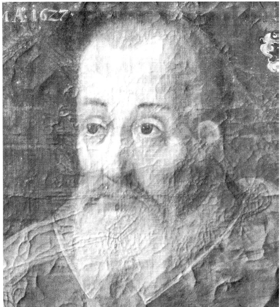
Fürstbischof Johann V. Flugi von Aspermont (1601–1627) Bischöfliches Schloss, Chur; Foto Albert Fischer.

Nachfolger Johanns V. Flugi, der am 24. Juni 1627 aus Gesundheitsgründen zurücktrat und am 30. Juni starb, wurde der aus Mals im Vinschgau (bzw. elterlicherseits aus Zernez im Engadin) stammende Joseph Mohr, der seine Ausbildung an Jesuitenkollegien im Ausland erhalten und in Mailand promoviert hatte. Er setzte das Reformwerk durch Visitationen im Vinschgau und im Misox sowie durch Förderung der Rätischen Kapuzinermission in der Surselva, im Unterengadin und im Münstertal fort. 1629 richteten Bischof und Domkapitel ein Generalrestitutionsbegehren an die Drei Bünde und wandten sich auch an Erzherzog Leopold. Doch die Innsbrucker Einigung von 1629 belies es bei allgemeinen Formulierungen; sie gab den Geistlichen zwar das Recht, unter der Obhut Österreichs die Restitution einzufordern, aber Österreich bemühte sich nicht um eine Umsetzung der Vertragstexte von 1622/23. Kurz vor seinem Tod an der Pest (24. Juni 1635) richtete Mohr nochmals eine Denkschrift in dieser Angelegenheit direkt an Kaiser Ferdinand II., ebenfalls ohne Erfolg. Besondere Sorge bereitete der Anstieg der Schulden des