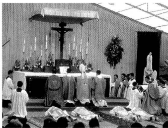
Lefebvre weiht 4 Bischöfe

Am 1. November 1970 unterschrieb der damalige Bischof von Lausanne-Genève-Freiburg, François Charrière, das Gründungsdekret der "Priesterbruderschaft St. Pius X." für eine sechsjährige Probezeit. Von einem Seminar war nicht die Rede, sondern von einer "frommen Gemeinschaft" mit Sitz in Freiburg, wo Lefebvre ein Haus erworben hatte. Da