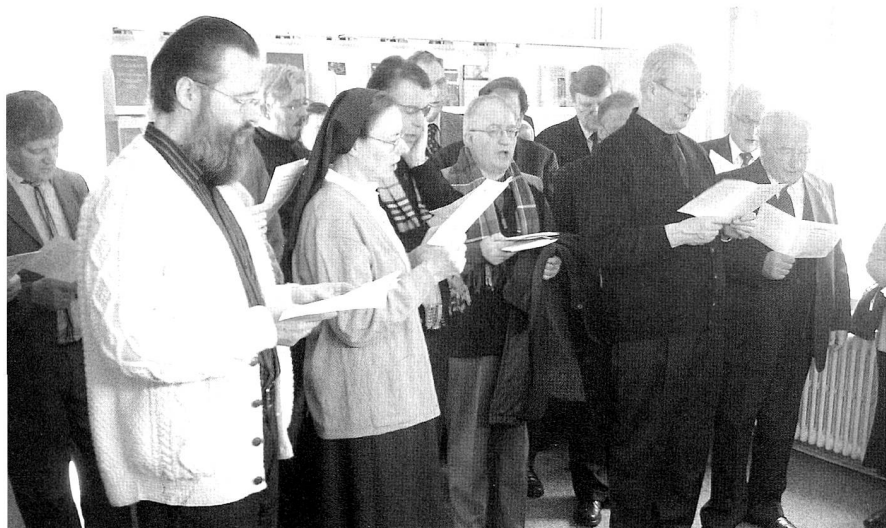
Mitfeiernde bei der Einsegnung der Räume des Liturgischen Instituts.