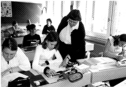
Unterricht in der Guglera: Alternative zur öffentlichen Schule.

Derzeit besuchen 100 Schülerinnen die Guglera, 80 davon das Internat. Etwa ein Viertel der Schülerinnen sind franzö-