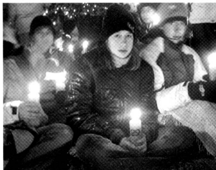
Stimmungsvoller Ranft-Gottesdienst im Kerzenschein mitten in der Nacht.

der Wortgottesdienst stattfand. Es war einer der Höhepunkte des Ranfttreffens, als alle 2.500 Teilnehmerinnen und Teilnehmer gemeinsam ihre Ranfttreffenkerze entzündeten. Der Bundespräsident der Jungwacht und die Präses der katholischen Pfadfinder gaben den Teilnehmenden am Wortgottesdienst mit, sich ihrer Grenzen bewusst zu werden. Wenn sie Limits übertreten, sollen sich die Ju-