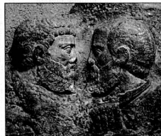
Zeugnis · Begegnung · Wirkung