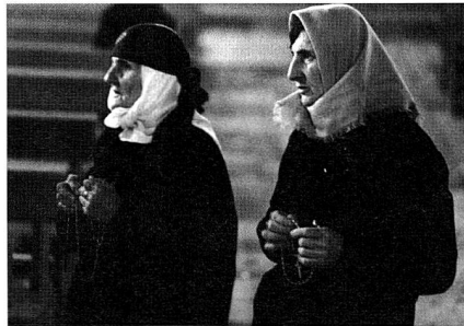
Albanische Katholikinnen.

Unter den rund 500.000 Einwohnern von Pristina gibt es zwar nur 1.250 Katholiken. Dennoch soll nach den Vorstellungen der Kirchenführung auf dem geschenkten Landstück ein veritabler Katholiken-Komplex entstehen: Kathedra-