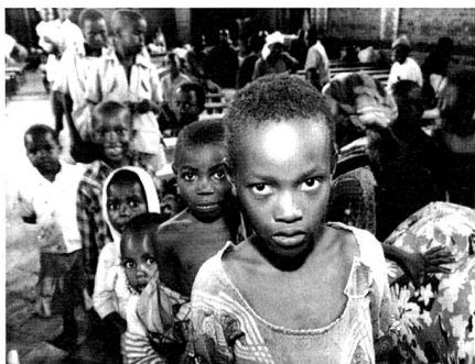
1994 in Kigali: Tutsi-Kinder suchen in der Kirche der Heiligen Familie Schutz vor Hutu-Milizen.

Der Grossteil der zwei Millionen Flüchtlinge wurde integriert, die Gefahr eines militärischen Gegenangriffs gebannt. Ruanda erhielt internationale Anerkennung und Entwicklungshilfe. Eine Verfassung und Wahlen haben das Kagame-Regime legitimiert.