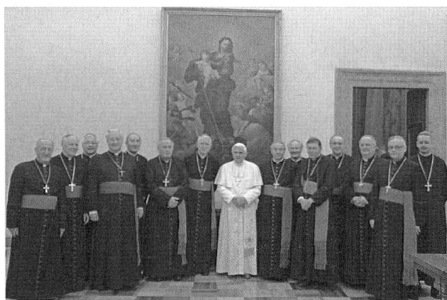
Gruppenbild mit Papst: Die Schweizer Bischöfe in Rom.

Den Glauben könne man sich nicht selber ausdenken oder aus beliebigen und verkraftbaren Stücken zusammensetzen, unterstrich das Kirchenoberhaupt. Vielmehr müsse er "in und mit der Kirche" erfolgen. Alle Aktivitäten, die Werke der Nächstenliebe und auch die Entwicklungshilfe müssten aus der Mitte des Glaubens an Gott erfolgen.