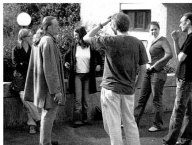
Die Mitglieder der WG und ihr Coach sein.

ben, die eigenen Werthaltungen, über Glaubensfragen. Die Dialoge sollen pointiert, provokativ, humorvoll, frech