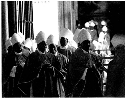
Bischöfe an der Afrikasynode

Besondere Ratschläge gibt die Synode den kirchlichen Mitarbeitern, Priestern, Seminaristen oder Katecheten. Sie wendet sich an Politiker und gibt Emp-