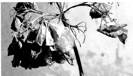
Verblühtes Leben – auch im Internet

Das Medium Internet ist unbegrenzt, auch zeitlich, Menschen finden hier immer Gesprächspartner. Dem Nutzer gibt