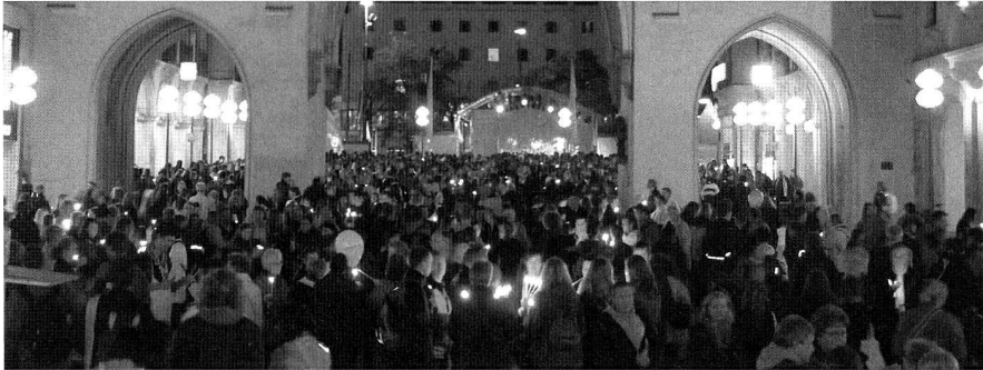
Abend der Begegnung am Kirchentag in München.

München. – Die Ökumene, sagt Alois Glück, hat sich als "wetterfest" erwiesen. Da klatschen die Zuhörer beim Abschlussgottesdienst des 2. Ökumenischen Kirchentags (ÖKT) am Sonntag, 16. Mai. Jeder weiss, dass der katholische Präsident des ÖKT nicht nur Regenschauer und kühle Brisen meinte. In wirtschaftlichen und kirchlichen Krisenzeiten bot das fünftägige Christentreffen viele Wolken und gelegentlich ein Stück vom Himmel.