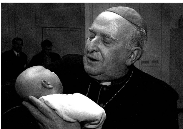
Bischof Grampa 2008 beim Besuch des Caritas-Baby-Hospitals in Bethlehem

Begründet oder nicht, diese Haltung verwundert, hatten doch die Schweizer Bischöfe eigens Überlegungen zum Priesterjahr veröffentlicht, in denen sie unter anderem die Notwendigkeit der Stärkung der Identität der Priester sahen und für Priesterexerzitien, Wallfahrten und Gespräche mit ihren Priestern plädierten. Die Gläubigen der Schweiz wurden zum Gebet für und um Priester aufgerufen, in Einsiedeln wurde eigens eine Priester-Wallfahrt organisiert – mit zwei Teilnehmern. "Es stellt sich die Frage der Nachhaltigkeit dieses Priesterjahres", schrieb der Churer Diözesanbischof Vitus Huonder unlängst in seinem Schreiben zum Abschluss des Priesterjahres an seinen Diözesanklerus. Die Frage scheint berechtigt. Andrea Krogmann