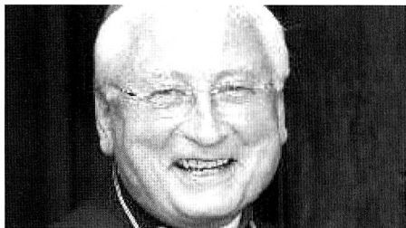
Walter Mixa will zurück ins Bischofsamt.