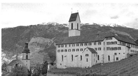
Konflikte gibt es auch in der Frage der Priesterausbildung an St. Luzi in Chur.

Gemäss der Darstellung von Binotto versucht das Bistum mit allen Mitteln, den Konflikt um die tridentinische Messe unter Verschluss zu halten. So habe