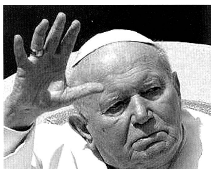
Papst Johannes Paul II.

Täglich schiebt sich eine ununterbrochene Schlange von Pilgern aus aller Welt an der Grabstätte des Papstes vorbei, der wie kaum einer seiner Vorgänger das internationale Ansehen des Papstamtes gefördert hat. Der mit seiner medienwirksamen Ausstrahlung und mit seinen charismatischen Initiativen Kirche und Welt faszinierte. Der mit seinen