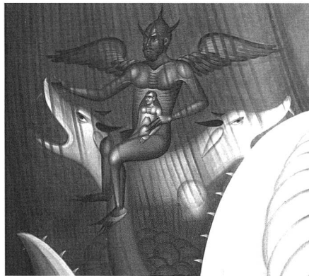
Endzeitdarstellung in einer Kirche

Weniger biblisch und eher ungemütlich wird es in der Weltuntergangsnacht im Elsass zugehen. Die Verantwortlichen der Bunkeranlage Schoenenbourg nehmen die Ängste der Endzeitjünger offensichtlich sehr ernst – und öffnen den örtlichen Weltkriegsbunker in der Nacht zum 21. Dezember. Für umgerechnet 8,40 Franken können Erwachsene hier mit etwas Glück den Weltuntergang überleben – Glühwein und Lebkuchen inklusive. Ähnliche Überlebenschancen haben Erdenbürger, die in einem privaten Bunker Schutz suchen. Allerdings nur, wenn sie sich zuvor um die richtige Ausstattung ihrer Notbehausung gekümmert haben. Profi-Bunkerausstatter Karl Hillinger berichtet in der Zeitung "Die Welt", Luftfilteranlagen, Dosenbrot und Energieriegel seien derzeit besonders gefragt.