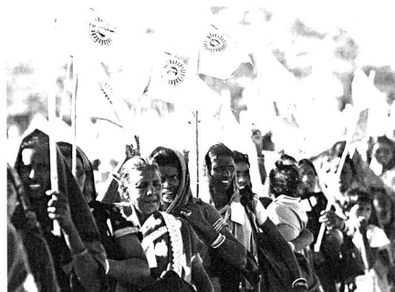
Indiens Christen im Fokus der Gebetswoche für die Einheit der Christen 2013

Hilfe für die Dalit kommt von den karitativen Einrichtungen der Kirchen. Für