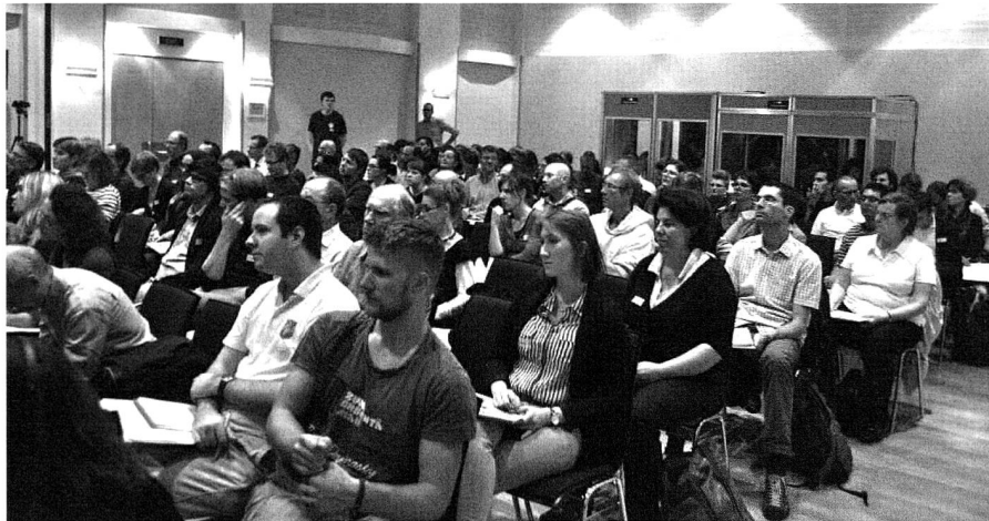
Der Grad an Betroffenheit ist gestiegen: Der Saal musste vergrössert, einigen Interessierten musste abgesagt werden.

Brot für alle und Fastenopfer fordern Transparenz in der Rohstoff-Lieferkette und so idealerweise die Abschaffung sozialer Missstände in den Zuliefererfirmen. Denn "Konfliktmineralien", also Mineralien, welche aus Minen in einem Kriegsgebiet stammen, sind heute in jedem Mobiltelefon enthalten. Ein Handy besteht aus fast 60 verschiedenen Mineralien. 96 Prozent der Weltbevölkerung verfügen über einen registrierten Mobiltelefon-Anschluss – die Nachfrage nach den Rohstoffen ist enorm. Laut