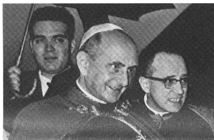
Papst Paul VI. im Oktober 1964

Manchem Zeitgenossen galt er als zaudernd und zögerlich; Journalisten karikierten ihn als «römischen Hamlet».