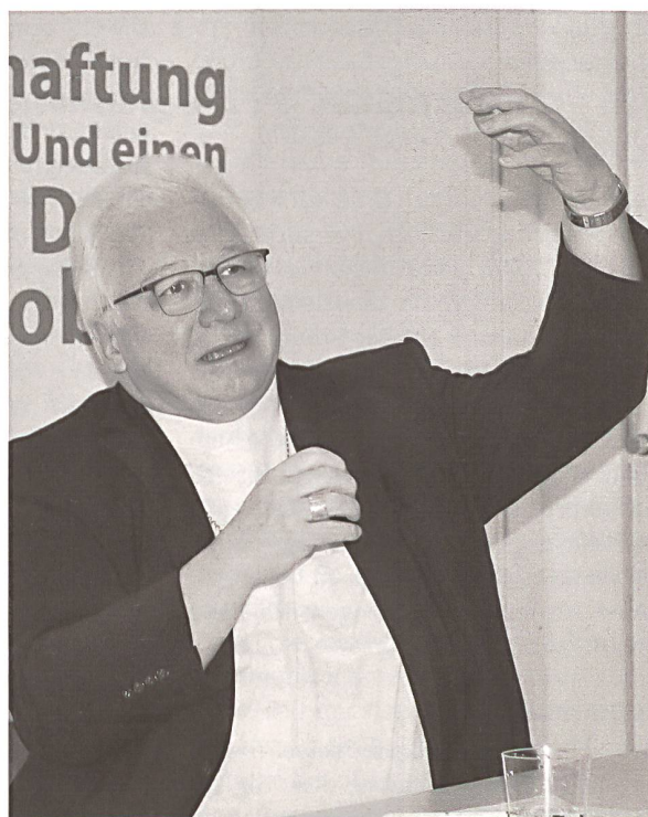
Bischof Markus Büchel

Der St. Galler Bischof und Präsident der Schweizer Bischofskonferenz Markus Büchel äusserte sich am Donnerstag, 5. Februar, an einem Mediengespräch zu aktuellen Entwicklungen in der katholischen Kirche. Es sei möglich, dass es künftig in einer Stadt nur noch zwei Eucharistiefiern pro Wochenende gebe. Zum Vergleich: Laut Angaben des Bischofs wird heute an einem Wochenende in der Stadt St. Gallen an 20 verschiedenen Orten eine Eucharistiefier angeboten. (bal)