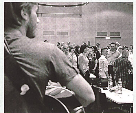
Gemeinsames Musizieren beim Firmbegleitungs-Treffen.

Seit 2011 ist die Firmung im jungen Erwachsenenalter im Bistum St. Gallen flächendeckend umgesetzt. Durchschnittlich gut zwei Drittel der angeschriebenen jungen Erwachsenen machen sich mit weit über 300 ehrenamtlichen Firmbegleiter/-innen und Seelsorgenden im Bistum gemeinsam auf den Firmweg. Dieser umfasst mehrere Treffen (an Abenden oder auch am Samstag, je nach Arbeitssituation der Firmlinge), in der Regel ein Wochenende und bei den meisten Firmgruppen auch eine Firmreise. «Mein Leben leben», «meinen Glauben leben», «gute Zeichen – Taufe und Firmung», «Leben, Tod und Auferstehung», «Gott als Geist unter uns» sind für den Firmweg vorgegebene Themen. Dazu werden aktuelle Fragen aufgegriffen wie Migration oder Sterbehilfe. Meist gehört zusätzlich ein sozialer Einsatz in der Seelsorgeeinheit zum Firmweg. Vor der Firmung bekennen sich die Firmandinnen und Firmanden in einem öffentlichen Ja zu ihrem Weg, als Letztes spenden Bischof Markus Büchel oder Generalvikar Guido Scherrer die Firmung.