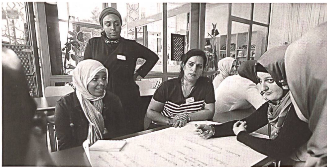
Interreligiöses Frauenparlament Bern