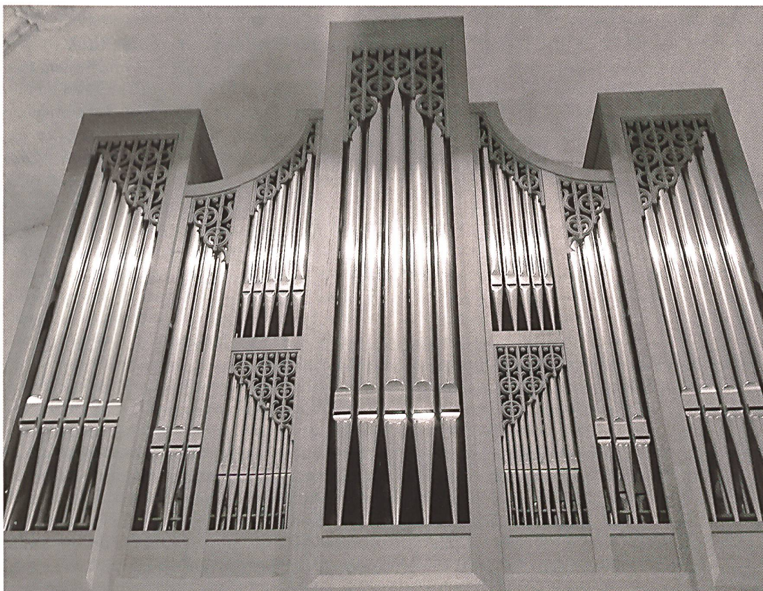
Orgelprospekt St. Mauritius Emmen.

Jenseits der angesprochenen Spannungen geht die Suche nach Öffnung zur Vielfalt an Musikstilen in der Praxis des Gottesdienstes mit Menschen unterschiedlichsten Alters und Herkunft weiter. Dies veranlasst zur vertieften Reflexion über Ideale, Praxen und Möglichkeiten musikalischer Umsetzung in gottesdienstlichen Feiern. Der Bedarf nach Integration neuer Musikstile und -formen bei der Feier christlichen Glaubens ist nicht vernachlässigbar. Im Kontrast dazu zeigt sich dagegen die Sichtweise auf Ebene der römisch-katholischen Weltkirche. Zwei Päpste aus dem europäischen Kulturraum haben ihre persönlichen Standpunkte markiert. Sie liessen meines Erachtens die erforderliche Öffnung auf die Vielfalt von Gesellschaften und Kulturen vermissen.