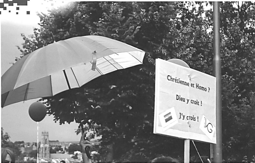
Pride-Parade in Freiburg 2016, im Hintergrund die Kathedrale