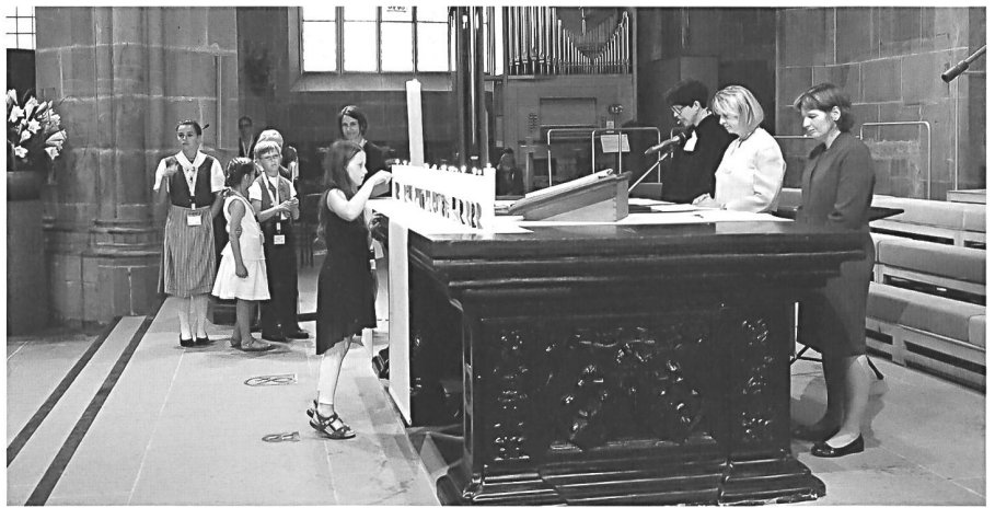
Fürbitten der Mitgliedkirchen des SEK

399. – Ab 399 Franken kann man mit Aldi Suisse Tours zum Papst reisen. Der Reiseveranstalter des Discounters Aldi Suisse hat die «Papstaudienz in Rom» in sein Angebot aufgenommen. Laut der Webseite ist ein Ticket zur Generalaudienz und die Segnung persönlicher Gegenstände durch Franziskus inbegriffen. Auf Anfrage versicherte das Unternehmen, dass der Segen für mitgebrachte Gegenstände «nicht im Rahmen eines Vier-Augen-Gesprächs geschieht». Der Segen werde für sämtliche Gäste und deren Gegenstände ausgesprochen. Diese Präzisierung fehlt auf der Webseite von Aldi Suisse Tours.