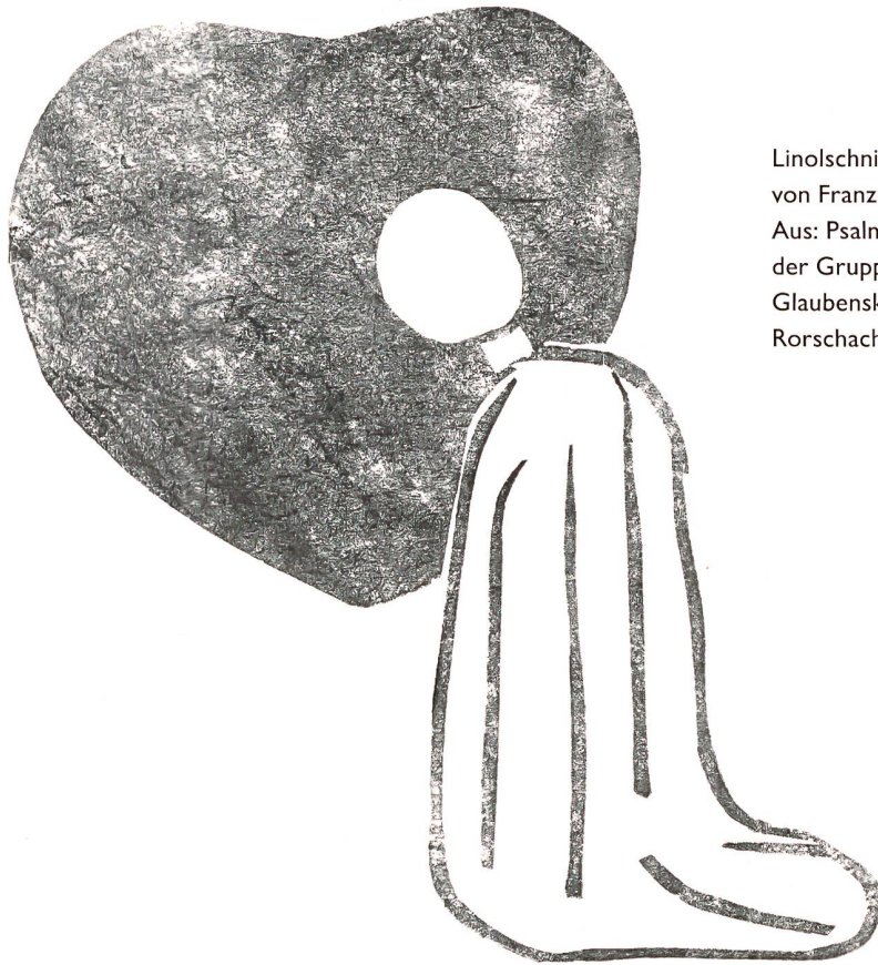
Linolschnitt von Franziska Gehr. Aus: Psalmenheft der Gruppe Katholische Glaubenskurse, Rorschach 1964.