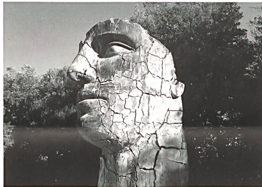
Igor Mitoraj: Tindaro Scropolato, Florenz.

Nach der Befreiung Italiens wird der Rechtsprofessor in die verfassungsgebende Versammlung gewählt, wo er von allen Seiten Respekt und Anerkennung erntet, weil er auf die andere Seite zugehen kann und nicht stur auf seinen Positionen beharrt. Nach einem Intermezzo als Staatssekretär in Rom schlägt seine Stunde, er wird zum Bürgermeister von Florenz gewählt. Sein ausserordentliches Engagement für die Armen war damals weitherum bekannt. Die Arnostadt war durch den Krieg stark getroffen: Alle Brücken ausser dem Ponte Vecchio waren gesprengt, viele Häuser hatten Schäden erlitten. Der neuge-