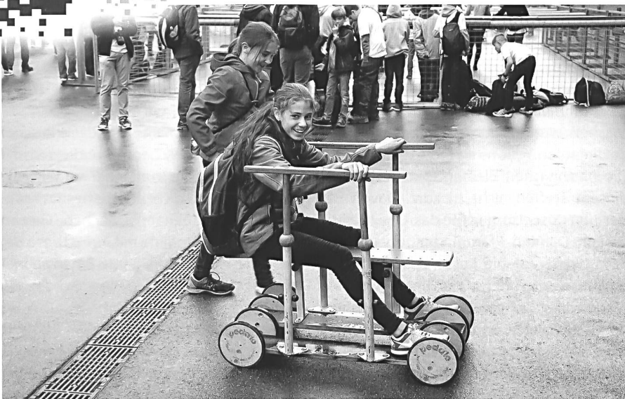
Zwei von 8000 Minis am Mini-Fest in Luzern