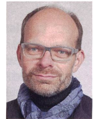
Luc Humbel ist der Kirchenratspräsident der röm.-kath. Kirche Aargau.