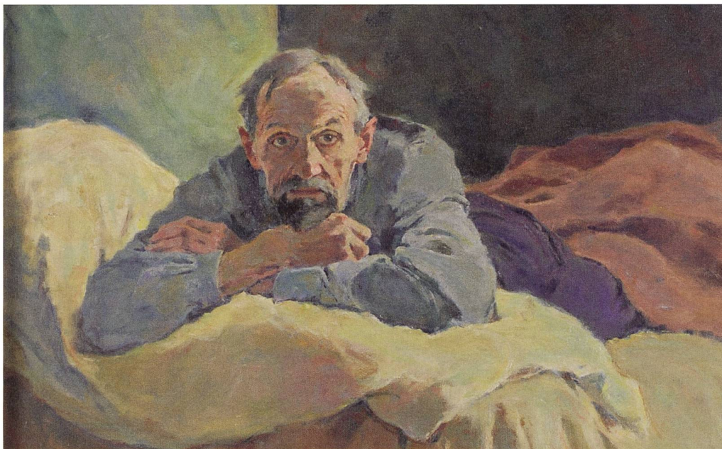
«Der Zweifler» von Gustav Jagerspacher (1879–1929).