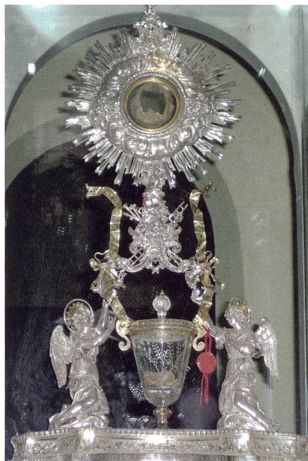
Die «Reliquien» des Wunders von Lanciano in ihrem Behältnis.

«Menetekel – Prophezeiungen, Visionen, blutende Hostien. Mysterium – Ungelöste Rätsel der Christenheit». Von Michael Hesemann. Paderborn 2017. ISBN 978-3-89710-729-8, CHF 29.90. www.bonifatius-verlag.de