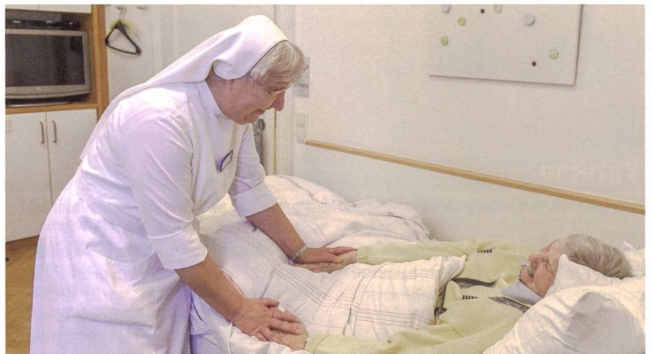
Eine Ordensschwester spricht in einem Hospiz mit einer Bewohnerin.