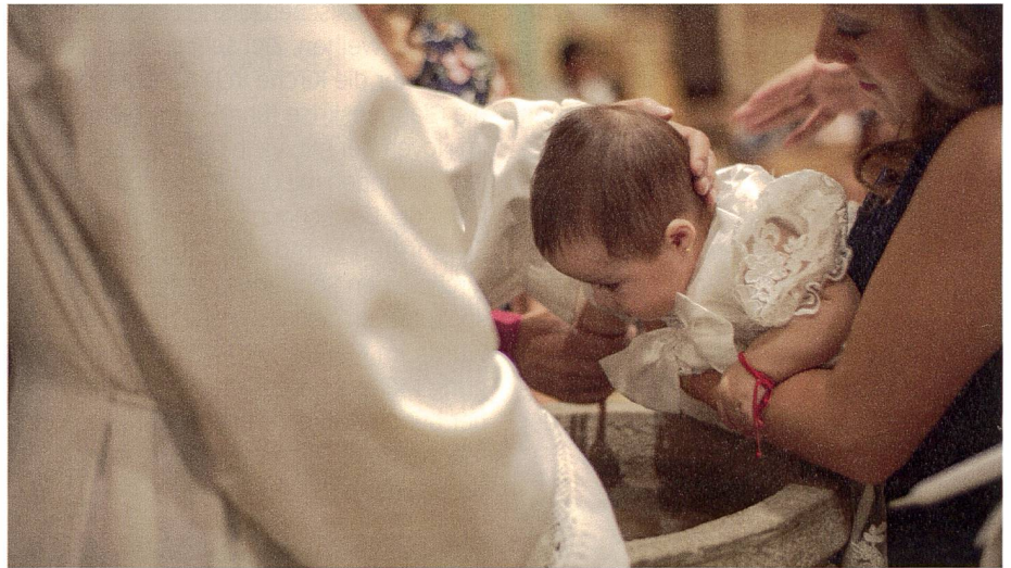
Ein Kind wird getauft.

Das SPI dokumentiert den Entfremdungsprozess unter anderem mit seiner Statistik zum Empfang der Taufe. So ist die Zahl der katholischen Taufen zwischen 2013 und 2018 um 11 Prozent gesunken. 2018 wurden 18 568 Menschen katholisch getauft. Dies entspreche zirka 21 Prozent der Geburten