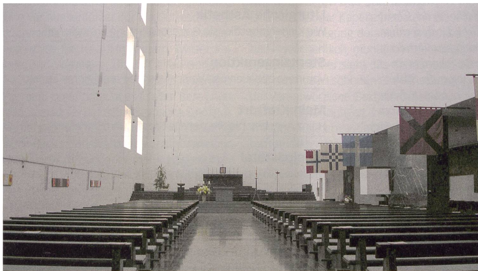
St. Fronleichnam in Aachen.