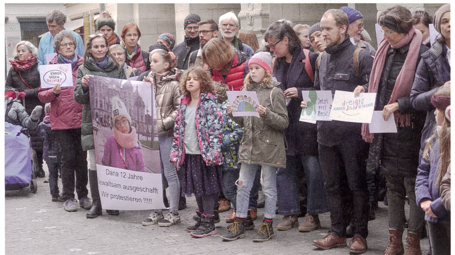
150 Personen kamen zur Übergabe der 4000 Unterschriften an die Luzerner Regierung.

Die Unterschriften – 2600 auf Papierbögen, 1400 online – sind laut der Kirche innert sieben Tagen zusammengekommen. Initiiert wurde das Schreiben von der IG Kirchenasyl, Vertretern der Katholischen Kirche Stadt Luzern sowie Sympathisierenden. Die Mutter und ihre Tochter waren aufgrund des Dublin-Verfahrens nach Belgien ausgeschafft worden. Zuvor hatten sie in Räumen der Luzerner Pfarrei St. Leodegar während eines Jahres Kirchenasyl erhalten. (sys)