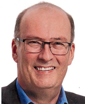
Markus Ritter ist Präsident des Schweizer Bauernverbands und Biobauer in Altstätten SG.

Die Landwirtschaft ernährt die Menschen. Diese Aussage dürfte unbestritten sein. Wenn es darum geht, wie diese Landwirtschaft auszusehen hat, gehen die Meinungen auseinander. Grundsätzlich gilt: Die Nachfrage bestimmt das Angebot. Weil Ananas gefragt sind, sind sie in unseren Läden das ganze Jahr über zu kaufen. Wem das Wohl der Ananasbauern am Herzen liegt, der kauft Fair-Trade-Ananas. Wenn