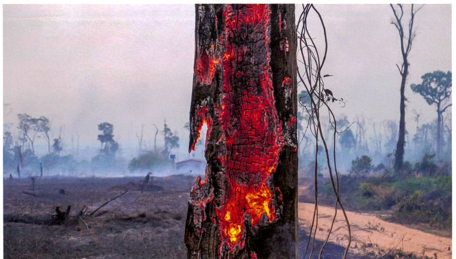
Brennender Urwald im brasilianischen Bundesstaat Mato Grosso

«Tragen wir zur Zerstörung des Amazonas bei, schneiden wir uns auch ins eigene Fleisch», mahnt der Basler Bischof. Deshalb gelte es einen Lebensstil einzuüben, der «weniger unersättlich ist, ruhiger, respektvoller, weniger ängstlich besorgt und brüderlicher», zitiert Gmür aus dem Papstschreiben. «Entscheidend ist dabei das Entwickeln einer neuen Haltung», so Gmür. (uab)