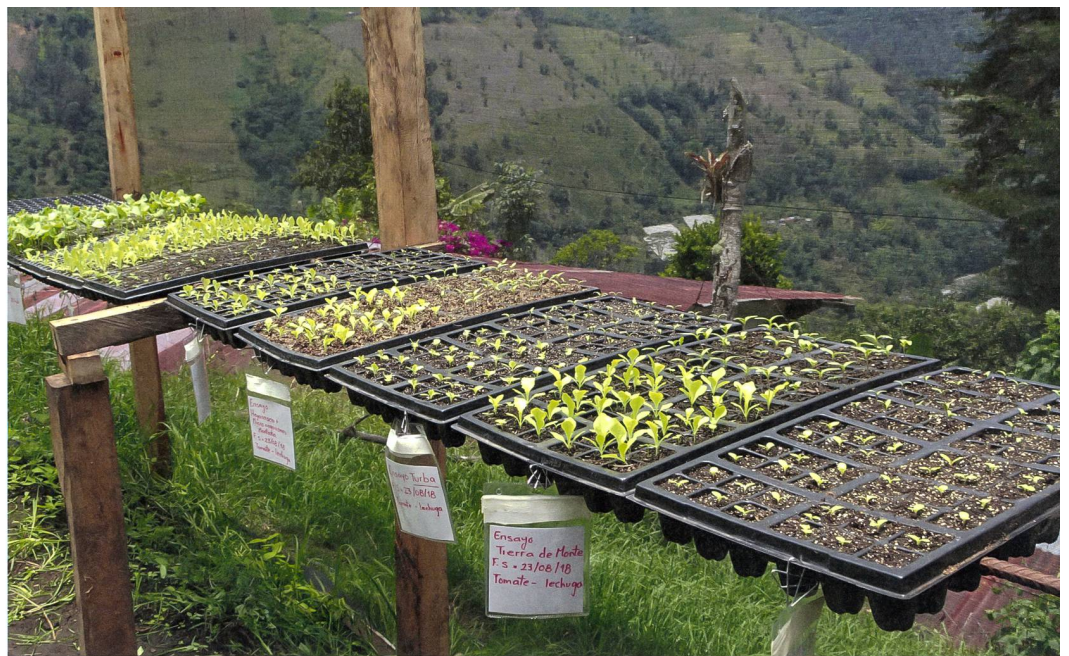
Saatgut in Kolumbien.

zu schützen. Die Folgen solcher Gesetze zeigen sich bereits in vielen Entwicklungsländern, die sie schon umsetzen mussten – das traditionelle Saatgut wird zurückgedrängt und die Kleinbäuerinnen und -bauern geraten in die Abhängigkeit. In der Schweiz fordern die Hilfswerke deshalb während der Ökumenischen Kampagne Pfarreien und Kirchgemeinden auf, sich solidarisch mit Malaysia zu zeigen und einen Brief ans Staatssekretariat für Wirtschaft (Seco) zu schreiben. 2 Das Seco ist verantwortlich für die Verhandlungsführung bei Freihandelsabkommen und bestimmt, welche Forderungen an die Partnerländer in Freihandelsabkommen seitens der Schweiz aufgegriffen werden. Vergangene Gespräche der Hilfswerke mit dem Seco blieben bis anhin fruchtlos. Auch für Partnerorganisationen in den Projektländern ist das Abkommen in dieser Form unverständlich. Viele Kolleginnen und Kollegen der Hilfswerke tragen die Aktion deshalb aktiv mit und schreiben ebenfalls einen solchen Solidaritätsbrief. Neben der Briefaktion unterstützen Fastenopfer und Brot für alle auch ausserhalb der Kampagne ihre Partnerorganisationen, sich lokal, national und international zu vernetzen und auszutauschen. Gemeinsam lernen die Kleinbäuerinnen und -bauern ihre Rechte kennen und lernen ihre Stimme auf politischer Ebene einzubringen. In der Projektarbeit von Fastenopfer bilden neben der Lobbyarbeit zudem Workshops in nachhaltigen und ressourcenschonenden Anbaumethoden einen Schwerpunkt.