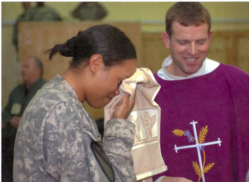
Menschen entscheiden sich oft erst als Erwachsene für die Taufe.

Wie bei allen pastoralen Fragen gibt es für eine Sakramentenkatechese im Wandel keine Patentrezepte. Auch wenn die individuelle Entscheidung der Menschen für das Christwerden und Christsein immer mehr in den Vordergrund rückt und die Frage nach entsprechenden Modellen in der Sakramentenkatechese zu überlegen und zu gestalten sind, gibt es immer noch traditionell gebundene Kriterien, die ebenso nach entsprechenden Modellen verlangen. Dies gilt insbesondere für eine Kirche wie die katholische in der Schweiz mit einem beträchtlichen Anteil von Migrantinnen und Migranten, für die z. B. sa-