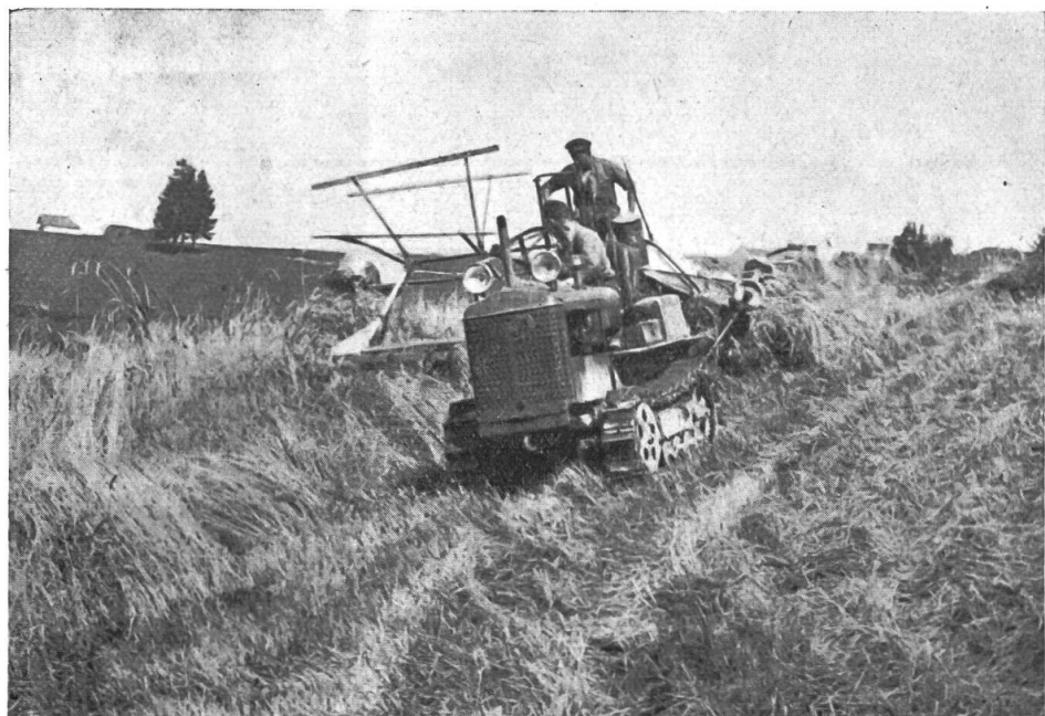
Erntearbeit am Berghang