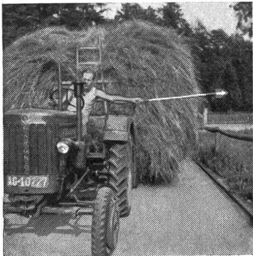
Traktorfürer mit Signalkelle (von vorn)

Das Abbiegen nach links mit voll beladenen Erntewagen kann auf einfachste Weise mit einer Signalkelle angezeigt werden.