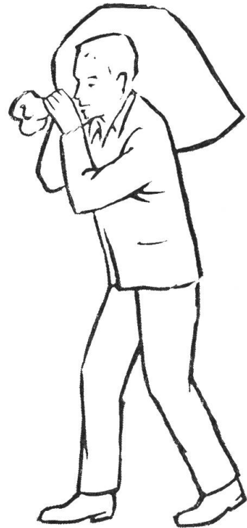
Trage Säcke und Kisten hoch auf den Schultern und halte den Körper gestreckt.

Es ist an sich nur normal, wenn ein Arbeiter nach Anstrengungen schwer atmet, wenn er Herzklopfen hat und sich erschöpft fühlt. Aber das sollte in kurzer Zeit verschwinden, wenn die Anstrengung vorbei ist. Wo das nicht der Fall ist, hat sich der Arbeiter zuviel zugemutet. Lasst euch helfen, Chauffeure und Landarbeiter, wenn ihr schwere Last zu bewegen habt. Wenn ihr euch wirklich überanstrengt und eurem Körper zuviel zugemutet habt, so verhaltet euch einige Tage ruhig. Das bringt das Herz in der Regel rasch zum Normalen zurück. Oft wird ein Schulternerv gedrückt. Es entstehen starke Schmerzen in Arm und Schulter, der Arm kann nicht mehr in normaler Weise bewegt werden. Die Behandlung ist langwierig. Namentlich Nervenstränge, die dicht unter der Haut gelegen sind, können durch starken Druck von aussen geschädigt werden. Die Muskeln, die von den geschädigten Nerven versorgt werden, sind dann weich und schlaff; es fehlt ihnen jede Kraft. Es kann so weit kommen, dass Arm oder Hand vorübergehend sogar gelähmt sind. Geeignete Behandlung und die Vermeidung weiterer Druckschädigungen der Nerven bringt alles wieder in Ordnung.