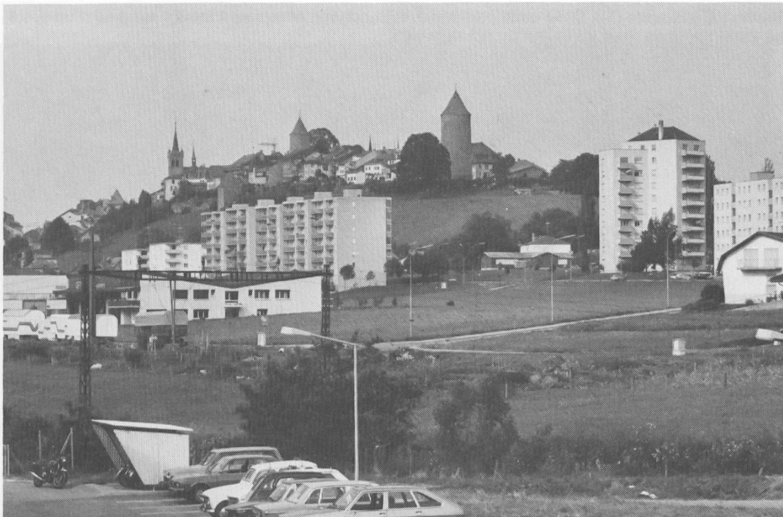
Und so zeigt es sich heute. Die Erhaltung von Ortsbildern scheitert nicht am Schutz von Fassaden und Baudenkmalern, sondern am Bauchaos in ungeschützter Umgebung.