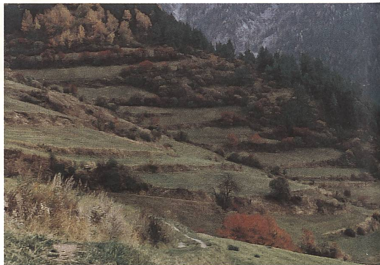
Ein jahrhundertelanger Ackerbau wurde auf den Terrassen von Ramosch betrieben

3 42 Nach eingehenden Diskussionen unterzeichnete die Trägerschaft eine gemeinsame Vereinbarung, welche die Rechte und Pflichten der Projektpartner festhält. Auch wurde neu eine Projektkommission vor Ort eingesetzt, die sich aus Vertreter/innen der Gemeinde, der Land- und Forstwirtschaft, des Kantons (landwirtschaftlicher Betriebsberater) und der SL zusammensetzt. Als erste Massnahme sollen im Frühjahr einzelne Zufahrten zu Parzellen sanft saniert werden, so dass die Landwirte für die Bewirtschaftung im steilen Gelände nicht gleich Kopf und Kragen riskieren müssen. Auch werden Varianten geprüft, die Stützmauern entlang der bestehenden Bewirtschaftungswege neu aufzubauen, da sie dem Hangdruck zunehmend weniger Stand halten. Zudem ist die Einrichtung eines Sortengartens in Ramosch geplant, ein Projekt der Gran Alpin zur Förderung der Saatgutgewinnung von alten Getreidesorten.