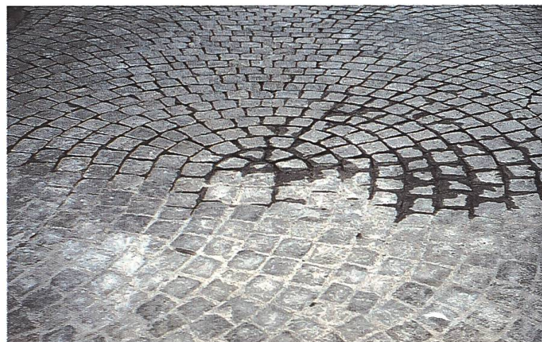
Neues Kopfsteinpflaster im alten Dorfteil von Mex

• Grabs SG: Die Landschaft am Grabserberg ist eine intakte Kulturlandschaft mit zahlreichen naturnahen Lebensräumen und einem ausgedehnten Netz an Trockenmauern. Sie wurden zudem teilweise als Moorlandschaft von nationaler Bedeutung ausgeschieden. Der Grabserberg ist auch Teil des BLN-Gebietes Speer–Churfürsten–Alvier und mit einer Schutzverordnung geschützt. Die Gemeinde möchte Landschaftsaufwertung und Förderung der Regionalwirtschaft am Grabserberg verbinden und dazu verschiedene Massnahmen umsetzen. In einer ersten Phase ist die Wiederinstandstellung einer alten Hohlwegverbindung geplant, die teilweise von Trockenmauern gesäumt ist und die im Rahmen eines Ausgesteuertenprogramms wieder durchgehend begehbar gemacht werden soll. Mit einem Beitrag der SL kann damit eine landschaftsprägende Struktur aufgewertet und eine attraktive Wanderwegroute als Alternative zur geteerten Strasse geschaffen werden.