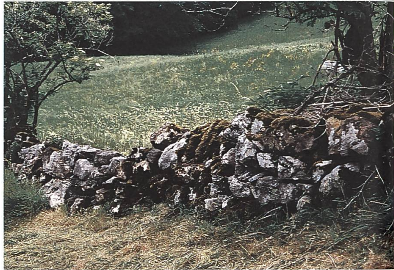
Die landschaftsprägenden Trockenmauern in Soulce bedürfen der Sanierung

Nach Beratung durch die SL packten die Gemeindebehörden den Stier mit derartiger Begeisterung bei den Hörnern, dass der Erfolg nicht lange auf sich warten liess. Das Projekt Soulce gewann den zweiten Preis im Wettbewerb der Henry Ford European Conservation Awards, gelangte zudem in den Genuss einer von DiAx gewährten Finanzhilfe von 10'000 Franken und erhielt schliesslich grünes Licht für die Umsetzung infolge der in Aussicht gestellten nachhaltigen Unterstützung durch den Fonds Landschaft Schweiz.