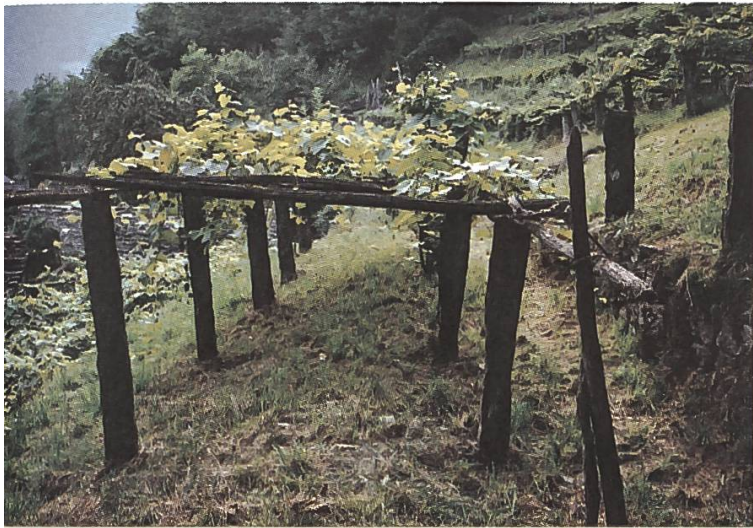
Une des nombreuses petites vignes dans le bas du Val Maggia

culturels et écologiques restent à découvrir. La remise en exploitation de quelques-unes de ces installations viticoles sera d'un grand intérêt pour un tourisme culturel, bien distinct du tourisme de masse. C'est par des projets de ce genre que la FP espère convaincre d'autres autorités et populations locales comme celles de Bosco Gurin de l'importance d'un entretien approprié du paysage.