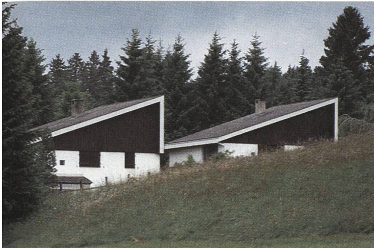
La construction à des fins touristique met la forêt en péril, comme ici à Lajoux JU

En ce qui concerne les objectifs de diversité biologique de la forêt, il serait souhaitable de les moduler en fonction des régions. Il ne s'agit pas seulement des réserves naturelles, mais de la qualité de l'ensemble des forêts. Les particularités des quelque 70 types de forêts de notre pays, selon Leibundgut, devraient être sauvegardées. C'est précisément là que les déficits sont considérables. Comment «convertir» la forêt du Plateau saturée d'épicéas? Comment entretenir les châtaigneraies dont la valeur botanique est grande? Il est regrettable que ces points n'aient pas été abordés dans le document présenté par la direction des forêts.