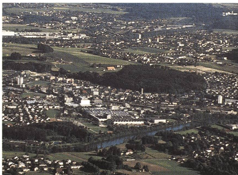
Der ländliche Raum in der Schweiz ist vielerorts nur noch ein Leerbegriff

Auf der anderen Seite hat sich auch die frühere Problemlage etwas verschoben: das ländliche Gebiet ist nicht mehr primär von der Abwanderung betroffen, sondern hat im Gegenteil zwischen 1980 und 1990 gar die höchsten Zuwachsraten aufzuweisen. In jüngster Zeit weisen die Kernstädte gemäss statistischen Daten des Bundesamtes für Statistik wieder ein leicht stärkeres Bevölkerungswachstum auf. Auch hat sich das Problembewusstsein bezüglich Zentrumslasten der Kernstädte insofern niedergeschlagen, als in der neuen Bundesverfassung von 1998 ein «Städteartikel» (Art. 50) aufgenommen wurde, der eine Rückspflicht auf die besondere Situation in gleichem Masse für die Berggebiete wie für die Städte und Agglomerationen verankert.