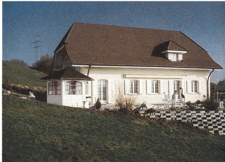
Wird die RPG/RPV-Revision solche Fälle vermehrt provozieren? Zonenkonformes Gärtnerhaus ausserhalb Bauzone bei Bern

aber die Anträge für Umnutzungen landwirtschaftlicher Gebäude zu Wohnzwecken stark steigen. So hat im Kanton Luzern die Nachfrage nach Umnutzungen von Ökonomiebauten für Ferienwohnungen auf dem Bauernhof deutlich zugenommen. Es zeichnet sich ab, dass die Umnutzungen von Ökonomieanteilen zu Wohnraum aus Renditegründen zu einem «Renner» werden. Dies führt allerdings zu einer schleichenden Verstädterung des ländlichen Raumes, zu Mehrverkehr und letztlich zu hohen Infrastrukturkosten. In Bezug auf die Rustici-Umnutzungen im Tessin ist keine sichtbare Abkehr von der bisherigen fragwürdigen Praxis festzustellen. Vielmehr bereiten der SL die zahlreichen Erschliessungsvorhaben Sorge. Diese werden heute als Forst- oder Alpstrassen projektiert und oftmals auch subventioniert, dienen aber nicht selten der Erschliessung von Monti (Tessiner Maiensässe), die dadurch bequem umgenutzt werden können. In Mezzovico, Rivera und Intragna intervenierte die SL gegen entsprechende Vorhaben. Sorgen bereitet zudem der nach wie vor hohe Anteil von illegalen Bautätigkeiten, sei es in Form von Wegausbauten